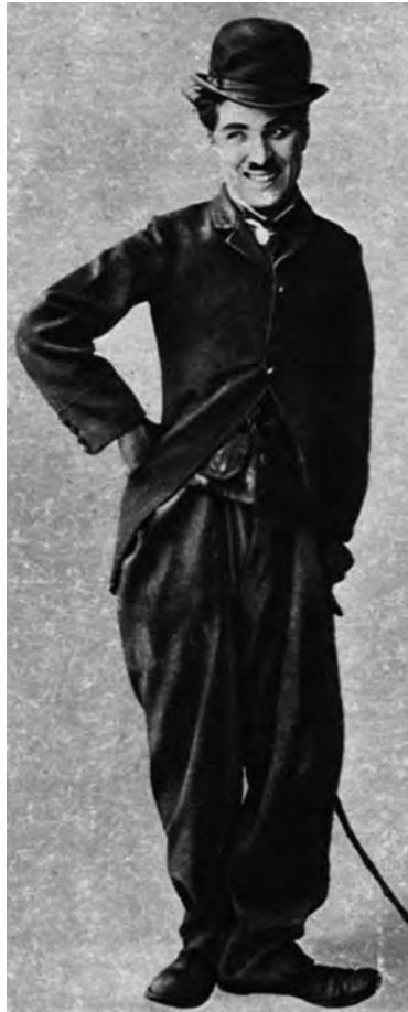
Figura 2 – Charles Chaplin, Charlot , 1914-1936

in https://en.wikipedia.org (consultado em novembro de 2017).