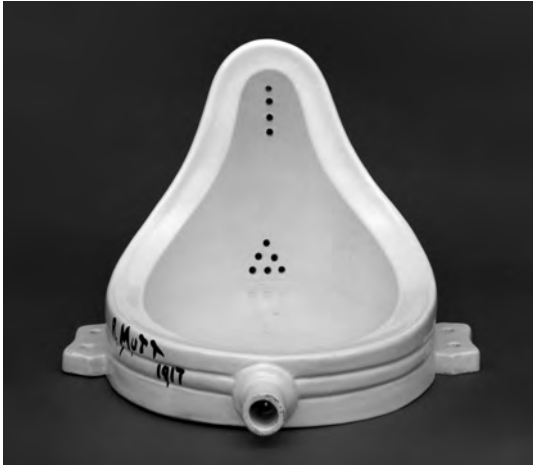
Figura 6 – Marcel Duchamp, Fonte , 1917, réplica de 1964, porcelana, 36 x 48 x 61 cm