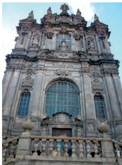
Figura 2 – Nicolau Nasoni, Igreja dos Clérigos , Porto, 1731-1763, fachada