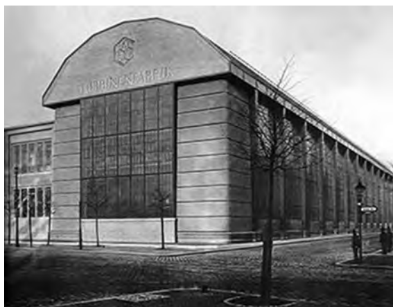
Figura 3 – Peter Behrens, Fábrica de Turbinas da AEG , Berlim, Alemanha, 1909-1910

3. Observe as Figuras 3 e 4 e leia o Texto B.