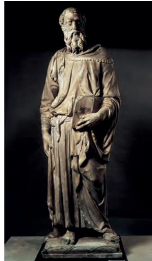
Donato Donatello, São Marcos , 1411, in http://warburg.chaa-unicamp.com.br .