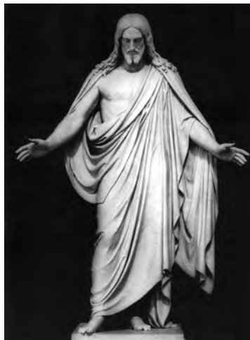
Bertel Thorvaldsen, Cristo , 1821, in www.wga.hu .

Associe cada obra referida na coluna A a uma das correntes artísticas constantes na coluna B .