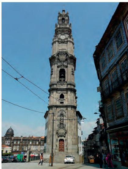
Figura 1 – Nicolau Nasoni, Torre dos Clérigos , Porto, 1731-1763