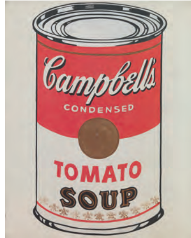
Figura 7 – Andy Warhol, Lata de Sopa Campbell's , 1962, polímero sintético sobre tela, 50,8 x 40,6 cm

5.1. As obras das Figuras 6 e 7 relacionam-se porque em ambas se utilizam