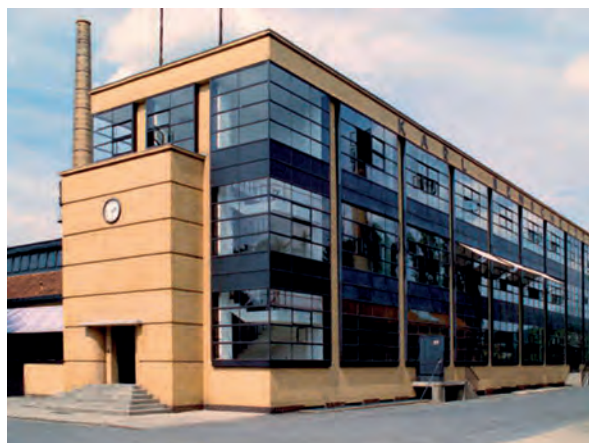
Figura 4 – Walter Gropius e Adolf Meyer, Fábrica Fagus , Alfeld an der Leine, Alemanha, 1910