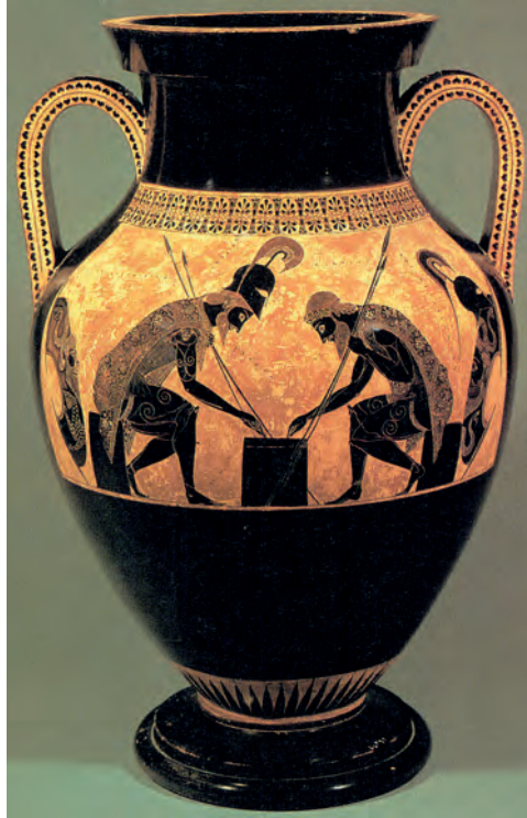
Figura 1 – Exéquias, Aquiles e Ajax jogando num tabuleiro, c. 540-530 a. C., ânfora em terracota, 61 cm