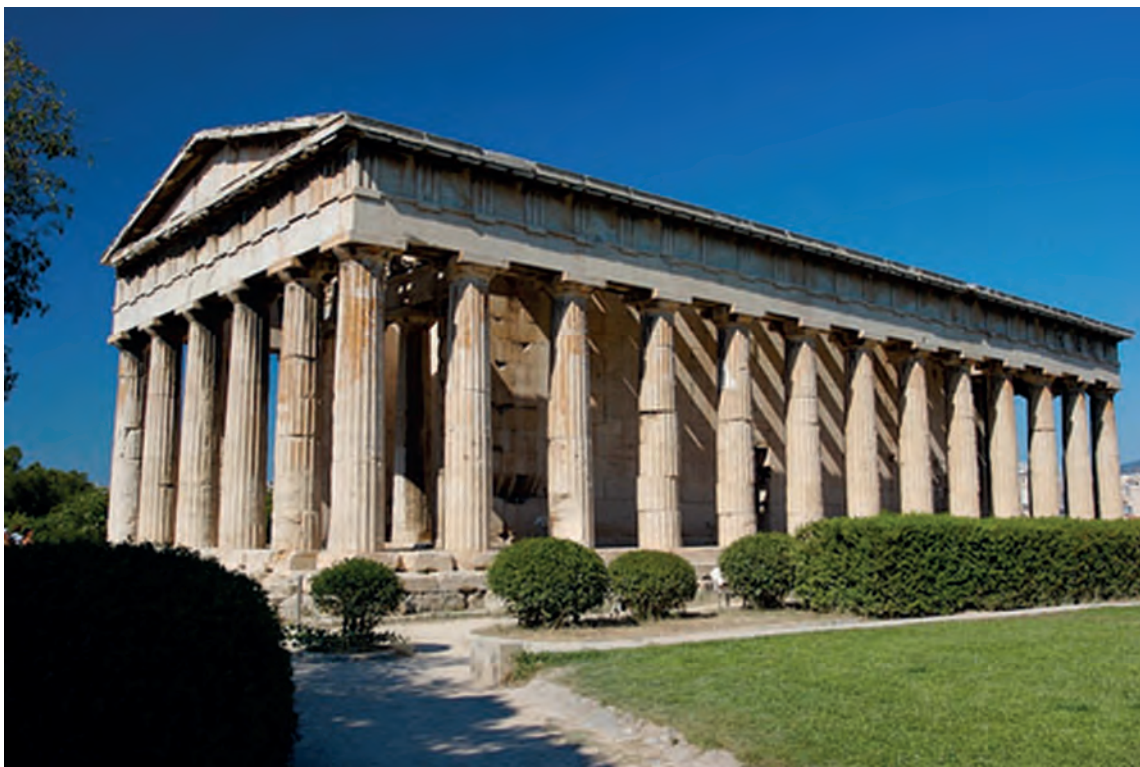
Figura 2 – Templo de Hefesto , Atenas, século V a. C.