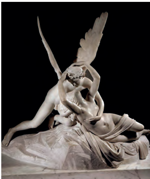
Figura 5 – Antonio Canova, Cupido e Psique , 1789-1793, mármore