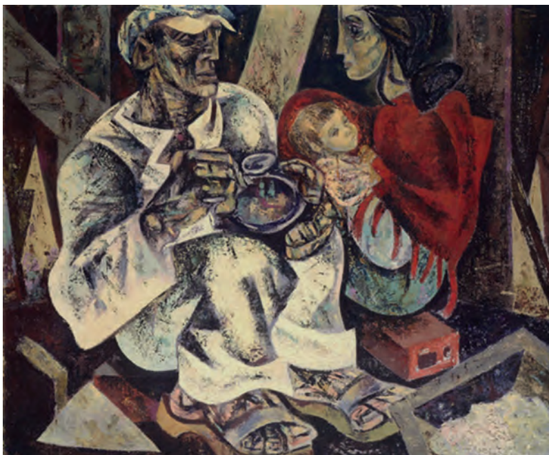
Figura 5 – Júlio Pomar, O Almoço do Trolha , 1946-1950, óleo sobre tela, 120 x 150 cm

in https://upload.wikimedia.org (consultado em novembro de 2017).