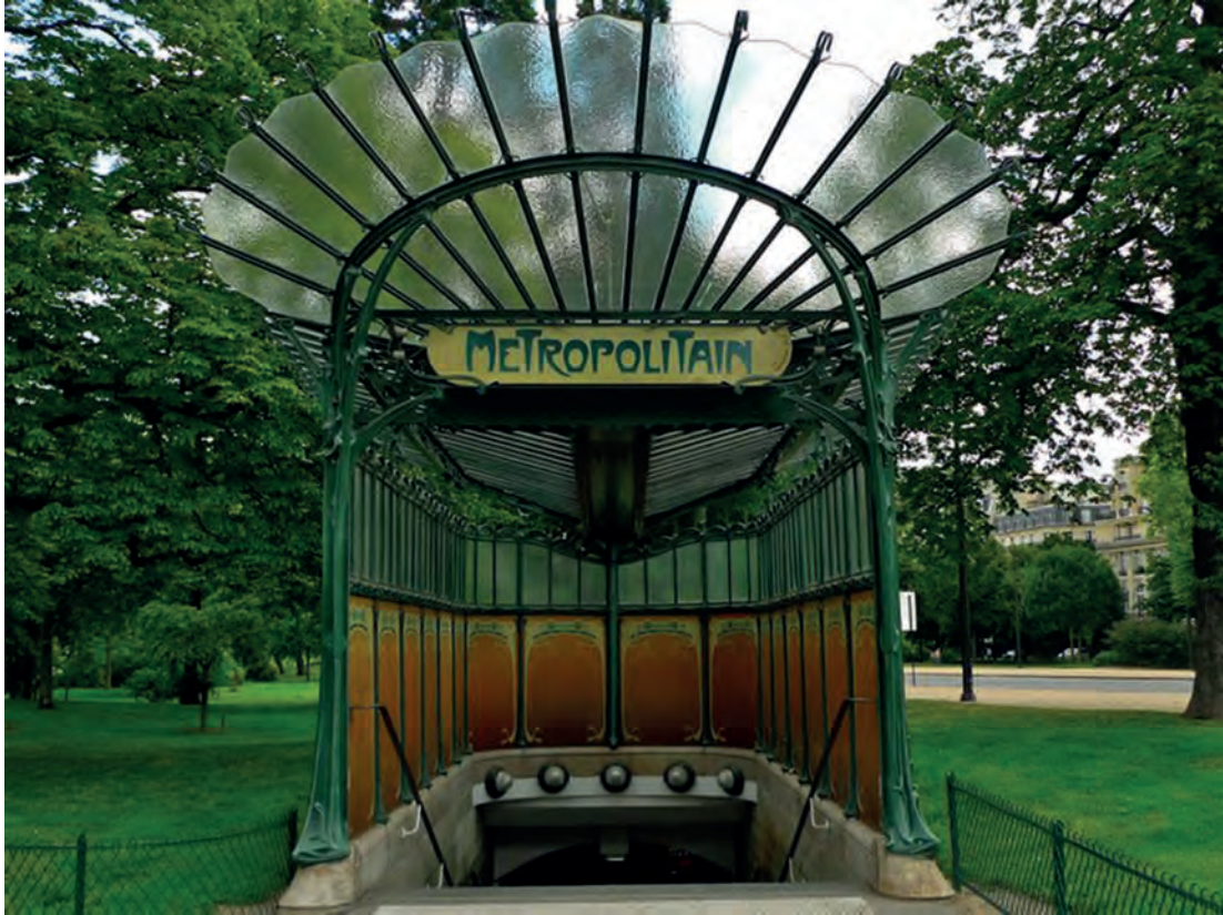
Figura 1 – Hector Guimard, Entrada da Estação de Metropolitano Porte Dauphine , Paris, 1898-1901

in https://pt.wikipedia.org (consultado em novembro de 2017).