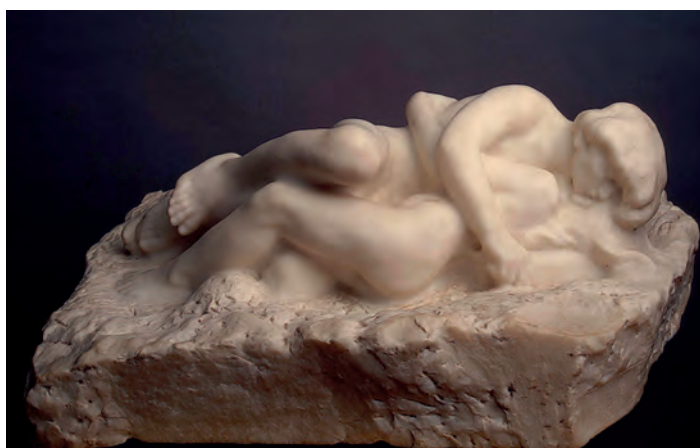
Figura 6 – Auguste Rodin, Cupido e Psique , 1905, mármore

Compare as esculturas reproduzidas nas Figuras 5 e 6.