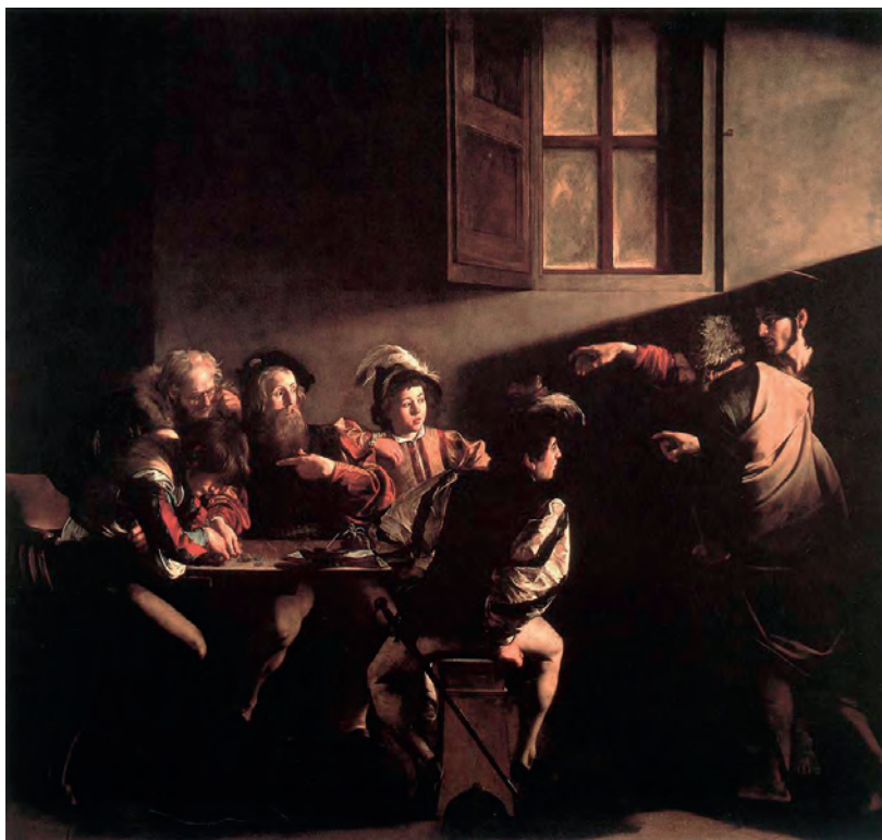
Figura 4 – Caravaggio, A vocação de São Mateus , 1599-1600, óleo sobre tela, 322 x 340 cm

in www.wga.hu (consultado em novembro de 2017).